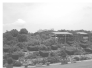
暑さ真っ盛りの花フェスタ記念公園