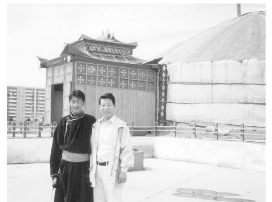
ウランパートル：観光用テント「ゲル」前

年度変わりの時期は総会や懇親会が目白押しで、議会本来の業務に支障をきたさないように調整するのに気を使います。