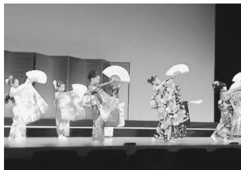
岐阜県青少年文化活動交流会（ジュニア文化祭）