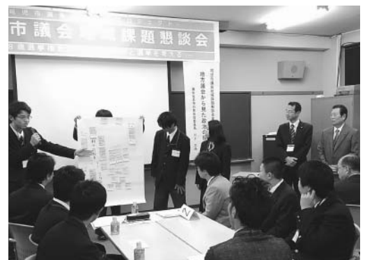
議会出前講座 IN 可児高校