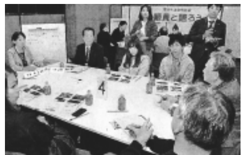
岐阜医療科学大学で初の議会報告会