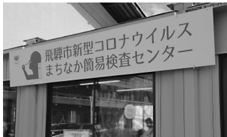
飛騨市の一般向け予約無し無料検査センター