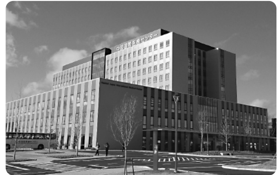
1月1日開院した中部国際医療センター

メリノウールは、素肌にとっても優しい特性を持ち、更に汚れにくい。汗の臭い分子も吸取してくれます。その上なぜか暖かくて涼しい不思議。洗濯機、乾燥機もOKの安心。これ以上ヒトに優しいモノが世にありますか？