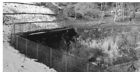
除草者の永年のボランティア活動に応じて設置された調整池安全柵（鳩吹台）