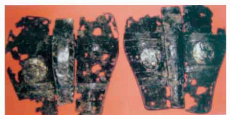
国内唯一 鎌倉時代の脛当