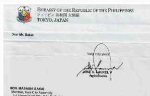
フィリピン共和国大使から レター