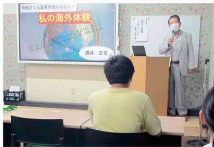
令和さくら高等学院で講演

▼子供が好き ◎中学校や高等学校へ職業講話やキャリア教育のお手伝いに毎年出掛けます。中学校応援団「エール広陵」に参加しています。 ◎子供達中心の和太鼓グループ「鳩吹昇龍会」を結成し、地域行事等に出演。アール出演2回。 ◎小中学校生の登校見守りが16年になりました。最高のご褒美は中学を卒業する子が「9年間見守り有り難うございました」の言葉。