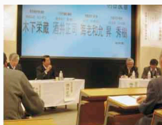
名城大学公開講座でパネラー

第60代議長に就任 議会基本条例制定 東日本大震災被災地、釜石市他慰問 慢性疲労性症候群救済意見書を国へ 名城大学撤退問題で大学本部に抗議 市購入水道料金の値下げを知事に直訴 市監査委員に初就任