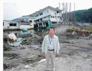
東日本大震災被災地慰問