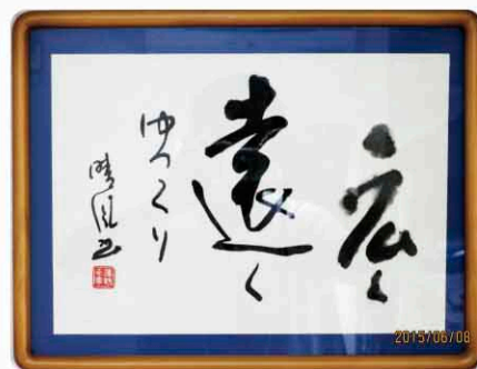
座右の銘 書家故澤野晴風先生書