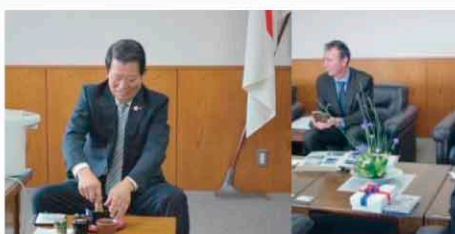
外国からの客人に（議長時代）