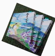
ひとりだち 岐阜県校長会編 中学生向け冊子

民生委員推薦委員会委員（3期） 市議定数報酬検討特別委員 熊本地震被災地、厚真町他慰問 市監査委員3期目就任 終活セミナー、地域で開催 中学校で職業講話（3回目） 広陵中学校応援団「エール広陵」参加