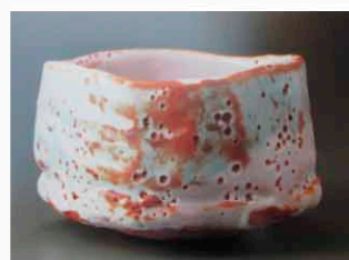
人間国宝 鈴木蔵氏作茶盃