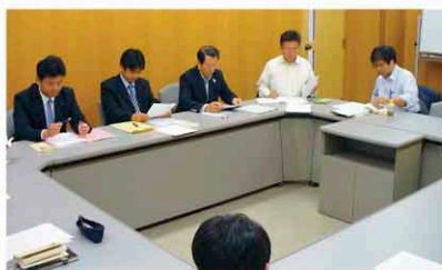
名城大学で昇ゼミ（12年間）