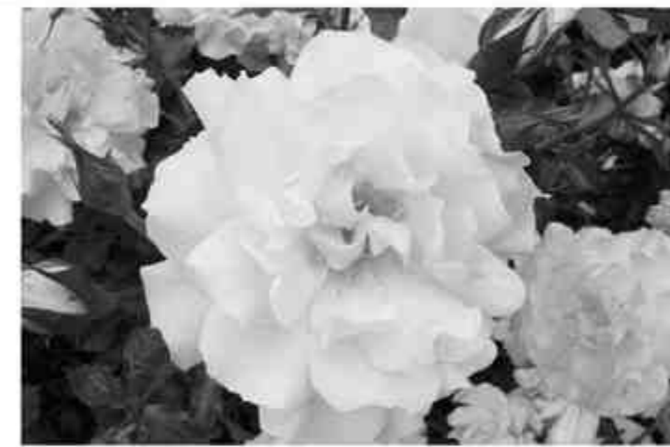
ファミリー(かに乙女)