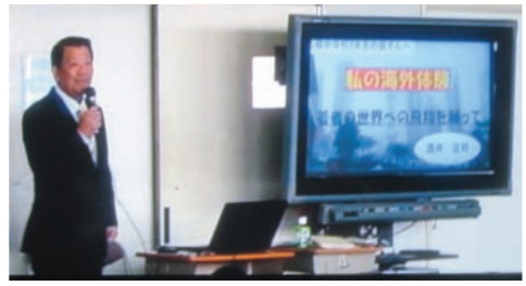
広い視野を持つ人に育って欲しいと、海外体験を話しました

な方にお薦め、冷暖房完備繊維、燃え難い、燃えても有毒ガスが出ない、土に帰り地球環境に良い等々と、強い思いだけの記事がナント多かったです。今までのボーと生きてきたことを反省し、何故ヒトに良いのか、チコちゃんに叱られないように次回から説明します。今後ともご愛読の程を。