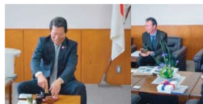
レッドランド市交流のキッカケになったAUST議員にお点前でオモてなし