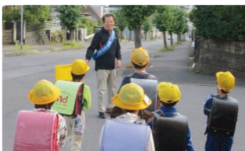
12年間見守りの褒美は子供の「9年間見守り有難う」